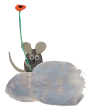
「フレデリック」1967年 Frederick © 1967, renewed 1995 by Leo Lionni/Pantheon

「2018 イタリア・ボローニャ国際絵本原画展 / 西宮市大谷記念美術館 / 8月11日(土)～9月24日(月祝)