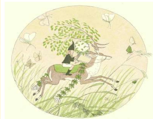
《不詳（小人と森の精）》